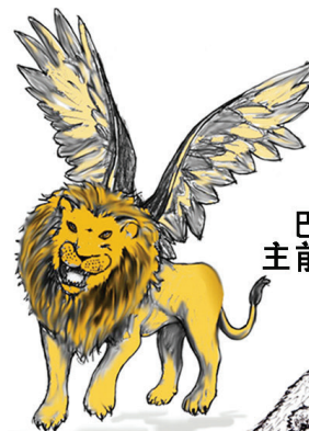
巴比伦帝国 主前606-536年