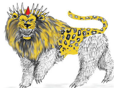
罗马帝国 主前63年 直到基督再来